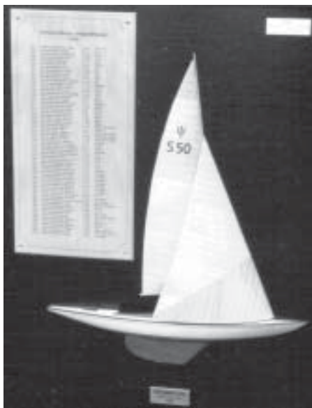
Ett av vandringsprisen för SM