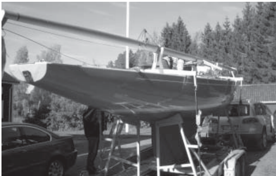
Klart för hemtransport

Dagarna gick och båtköpet diskuterades ofta och vi funderade på hur det skulle bli att segla henne. Ingen av oss hade tidigare seglat en Neppare så det blev en hel del