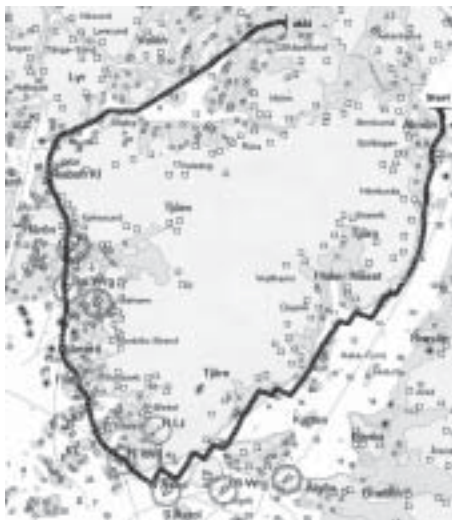
Vinnarspåret i 2007 års Tjörn Runt enligt vår GPS-plotter.

Avslutningsvis vill jag säga att Tjörn Runt definitivt är en av de roligaste kappseglingar jag någonsin varit med om under mer än 30 års kappseglande. Det var roligt 2004 men naturligtvis ännu roligare den här gången när vi med tur (och förhoppningsvis lite skicklighet) lyckades med det rätt otroliga att ta hem totalsegern. Förhoppningsvis kommer många andra Neppare att finnas med på startlinjen lördagen den 16 augusti i år när vi kommer att försöka försvara vår seger i 2008 års Tjörn Runt.