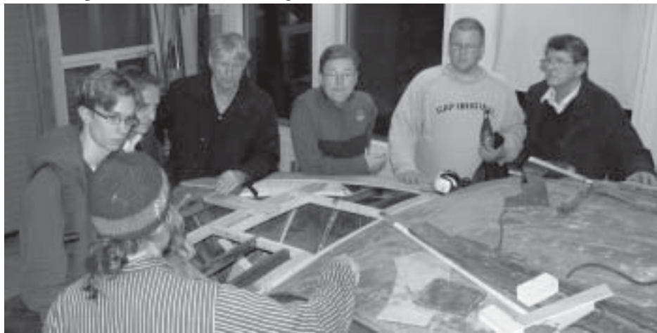
Intresserade åhörare som vill veta hur däckbyte går till

av renovering/färdigställande. Vi fick sen en mycket bra och uttömmande redogörelse för hur man byter kölbultar, bygger nytt dödrä, nåtlimmar, byter däck osv. Kvällen var mycket uppskattad och kommer säkert att upprepas vid senare tillfälle då vi kan fortsätta att diskutera det som inte hanns med den här gången.